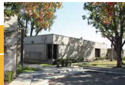
Los salones temporales como los que están en el Centro Educativo Centennial tienen problemas importantes de cimientos y techos que conllevan a inundaciones regulares durante las lluvias.

Se ha realizado una evaluación cabal de las necesidades de instalaciones del Colegio Santa Ana y reveló que se deben reparar y reemplazar techos en deterioro, plomería y sistemas eléctricos, se deben mejorar sistemas de seguridad del plantel, y se deben actualizar aulas, laboratorios e instalaciones anticuadas.