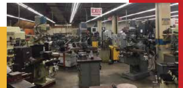
Các phòng thí nghiệm lỗi thời và các cơ sở giáo dục kỹ thuật nghề cần phải nâng cấp - như Phòng thí nghiệm Công nghệ Sản xuất, nằm trong một cơ sở chật chội, lỗi thời và nó không thể hỗ trợ hướng dẫn chất lượng.