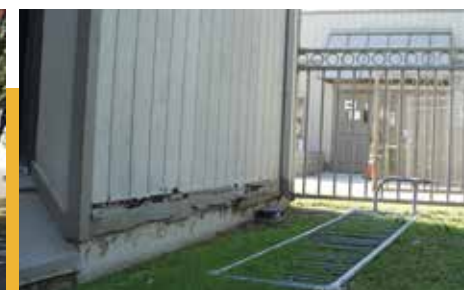
Các cơ sở lớp học tạm thời như các cơ sở tại Trung tâm Giáo dục Centennial có các vấn đề đáng kể về móng và mái nhà dẫn đến việc thường xuyên bị ngập khi trời mưa.